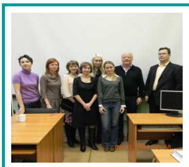
Модуль «Менеджмент, экономика и политика в здравоохранении»